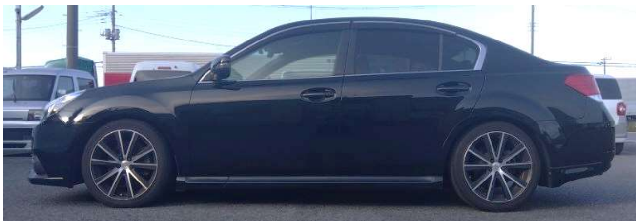
装着時画像 (Ft: -35mm / Rr: -35mm)

https://www.tein.co.jp/products/flex_z.html