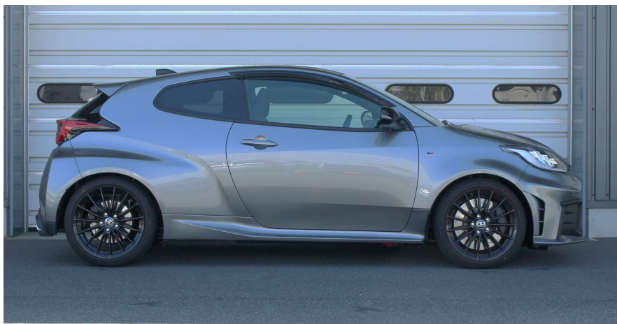
装着時画像 (Ft: -25mm / Rr: -20mm)

https://www.tein.co.jp/products/mono_racing.html