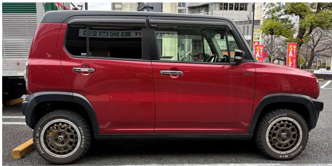
装着時画像 (Ft: 20mm / Rr: 25mm )

https://www.tein.co.jp/products/street_advance_z4.html