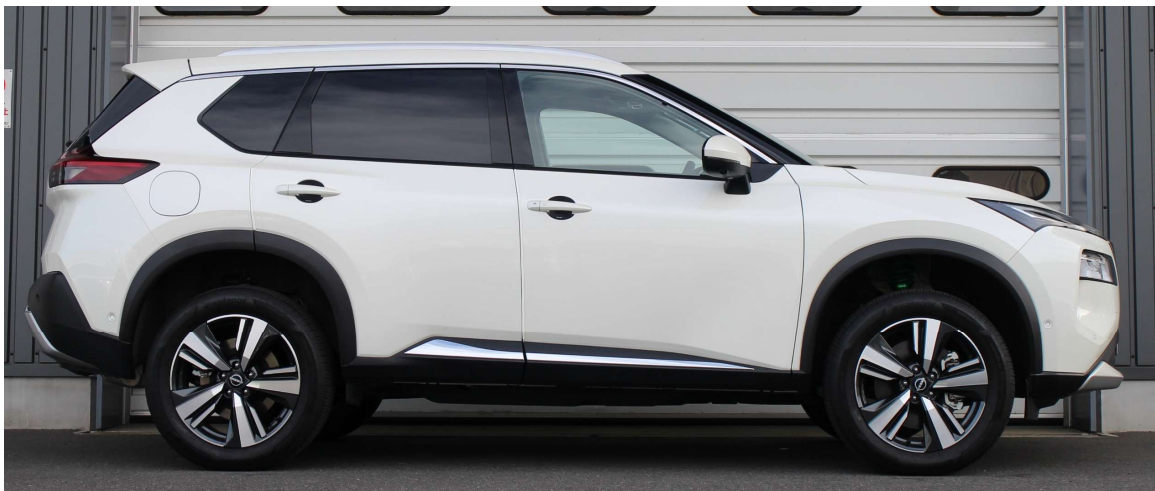
装着時画像 (Ft: 35mm / Rr: 35mm)

https://www.tein.co.jp/products/street_advance_z4.html