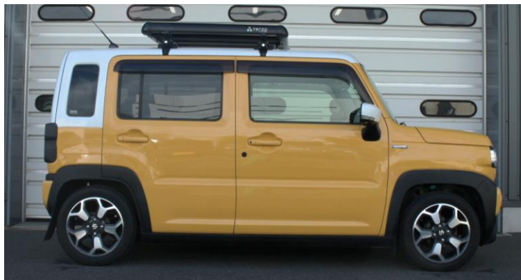
装着時画像 (Ft: -30mm / Rr: -45mm )

https://www.tein.co.jp/products/flex_z.html