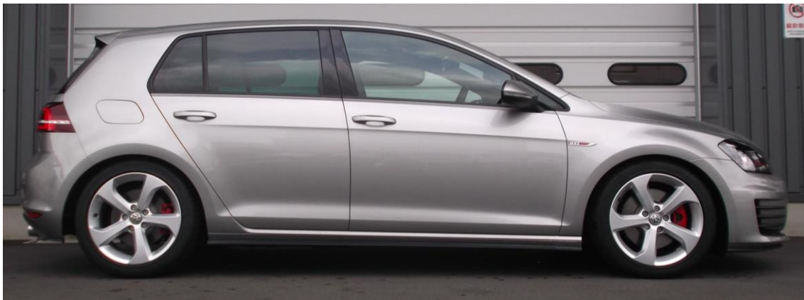
装着時画像 (Ft: -25mm / Rr: -25mm)

https://www.tein.co.jp/products/fs2.html